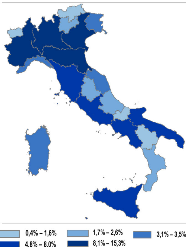
Grafico 3. Istituzioni non profit per regione. Censimento 2011, valori percentuali

Le aree che presentano una maggiore diffusione di istituzioni non profit registrano anche un bacino più vasto di risorse impiegate . Il Nord-est e il Nord-ovest registrano, infatti, il rapporto più elevato di volontari (pari rispettivamente a 1.146 e 892 per 10mila abitanti) e di dipendenti (141 e 156 per 10mila abitanti) rispetto alla popolazione residente. Approfondendo i dati territoriali, la presenza più significativa di dipendenti rispetto alla popolazione residente si rileva nella Provincia autonoma di Trento (con 193 addetti per 10mila abitanti), in Lombardia (171), Valle d'Aosta (167), Lazio (150) ed Emilia Romagna (148). Quasi la metà dei dipendenti impiegati nelle istituzioni non profit italiane (45,9 per cento) è concentrata in tre regioni: Lombardia, Lazio ed Emilia Romagna.